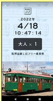
チケット画面イメージ

【購入方法】お手持ちのスマートフォンでRYDE社が運営するアプリ「RYDE PASS」からすぐにご購入いただけます。