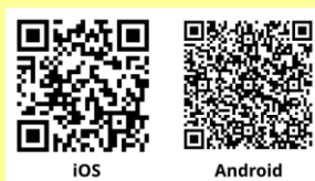
ダウンロード用 QR コード

App Store は Apple Inc. のサービスマークです。Android, Google Play は、Google Inc. の商標です。iOS 商標は、米国 Cisco のライセンスに基づき使用されています。