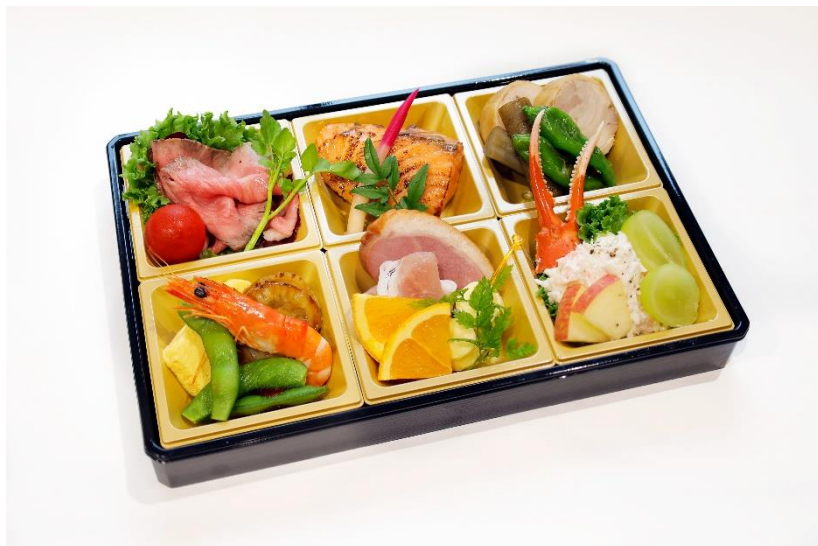
【ツアー特製オードブル】