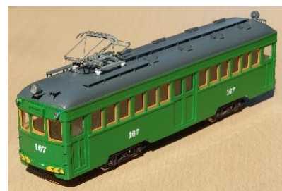
※写真は、モ161号ではありません