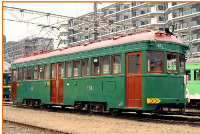
※修繕後のイメージ (画像は、前回の復原時)