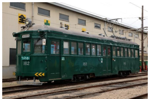
※阪堺電車で塗装する筑鉄電車のカラーリング 西鉄北九州線廃止20周年号【通称：赤電】