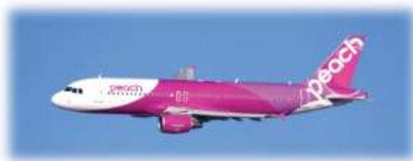
8月1日（水）より 大阪（関空）⇄釧路線を新規就航する 航空会社Peach