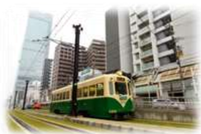
※貸切電車イメージ