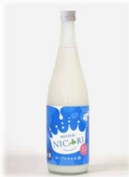
北海道産の牛乳を使用した 日本酒ベースのヨーグルト酒『みなニコリ』 ※お一人さま（720ml）1本付き