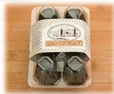
スモークドエッグ※イメージ (道北エリア/上川郡剣淵町)