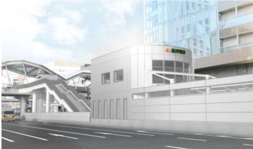
天王寺駅前停留場