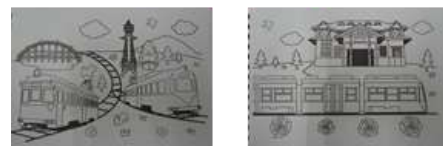
スケッチブック見本