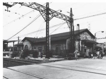
大正2年(1913年)7月2日 住吉神社前～住吉公園 複線開通 平成28年(2016年)1月31日 住吉～住吉公園 廃止